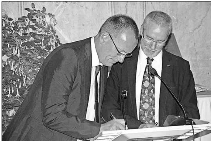
Der entscheidende Moment ...