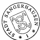
Sven Strauß Oberbürgermeister